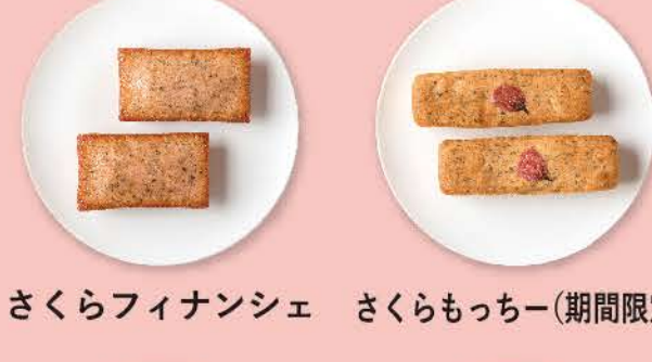
さくらフィナンシェ