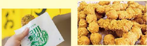
松崎のまち歩きには欠かせないアサイミートの川のりコロッケ

まち歩きの楽しみの一つが食べ歩き。松崎名産の川のりを使った揚げたてのコロッケやソルフードのさつま揚げ、日本一の桜葉塩漬けの町ならではの桜葉スイーツなど、グルメを楽しみながら町を巡ってください！