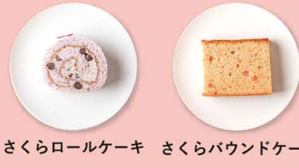
さくらロールケーキ