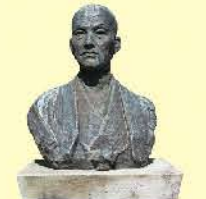
浄感寺にある入江長八の胸像