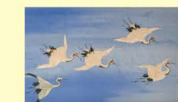
岩科学校にある長八の漆喰絵