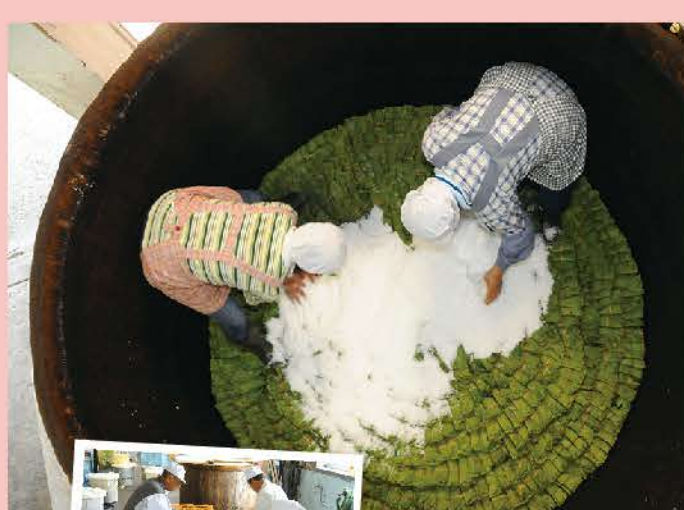
桜葉の塩漬けは葉の収穫から梅での塩漬けまで全て手作業で丁寧に作られています